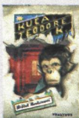
Nedžad Ibrahimović Kuća Teodora K.

Jedna od ponajboljih argentinskih spisateljica, magistrica komparativne književnosti na Sorbonni, u 35. godini, 2012., objavila je ovaj roman. Koji je, u prijevodu Duške Gerić Koren, objavila Hena.com. U zabačenom selu jedna žena s VSS-om osjeća se zarobljenom, čezne za slobodom i da bude dobra majka i žena. Ali istodobno ima poriv upotrijebiti pištolj ili nož. "Ova bolno iskrena ispovjedna proza propituje ljubav, majčinstvo, usamljenost, a ponajviše postporođajnu depresiju i sve mučne, suicidalne i sadističke misli koja ona sa sobom nosi", opisuje nakladnik.