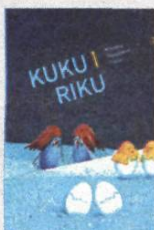
Nikolina Manojlović Vračar Kuku i Riku

Autor ovog romana, drugog iz trilogije započete "Inkapsuliranim tijelima", od 1989. do 2012. objavio je tri knjige eseja, zbirku poezije i snimio tri dokumentarna filma. Kao Fulbrightov profesor jednu je akademsku godinu u Seattleu predavao Južnoslavenski film i Južnoslavensku književnost u egzilu. Ovaj roman, koji je objavila zaprešička Fraktura, smješten je u ustanovu za mentalno oboljele u vrijeme rata. Oni se povezuju i razilaze, zaljubljuju i umiru, a pripovjedač se pita koji su uzroci zla i bolesti i nalaze li se oni unutar bolničkog kruga ili izvana njega.